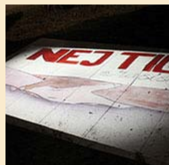
Vinnande bilder i omröstningen

Utvärdering. Utvärdering och återkoppling bör vara ett kontinuerligt inslag i deltagandeprocesser. Utvärderingen kan vara ett sätt att förbättra planeringen och projektets process och rapportera om vad deltagandet har resulterat i. Det finns ingen regel som säger att utvärderingen behöver vara omfattande. Om det är ont om resurser för att genomföra en utvärdering kan man välja att fokusera och reflektera över processen för deltagandet och deltagandets resultat (SKL, 2011b). Två frågeställningar som kan fungera som utgångspunkt för utvärderingen är: